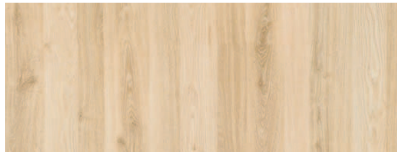
NATURALE / NATURAL