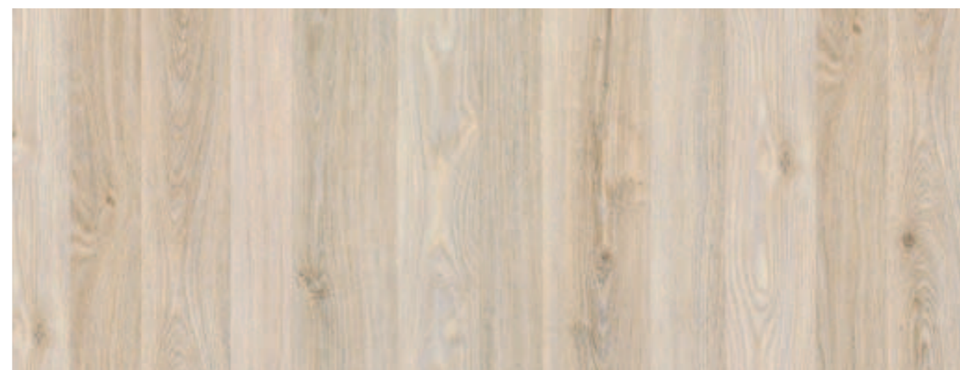
LEGNO GRIGIO / GREY WOOD