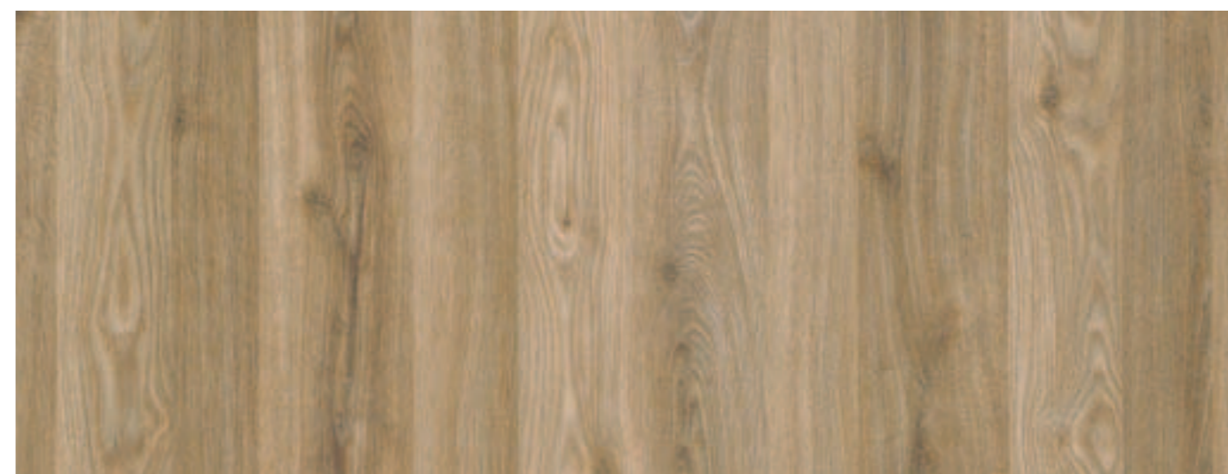
NOCE / WALNUT